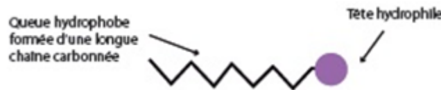
Figure 1. Représentation schématique d'une molécule tensioactive

Les tensioactifs appelés aussi agents de surface ou surfactants ( mot anglais ) sont des molécules à caractère amphiphiles , composés de deux parties : une partie polaire appelée tête hydrophile soluble dans l'eau et une partie apolaire d'une longue chaîne carbonée appelée queue hydrophobe (Figure 1).