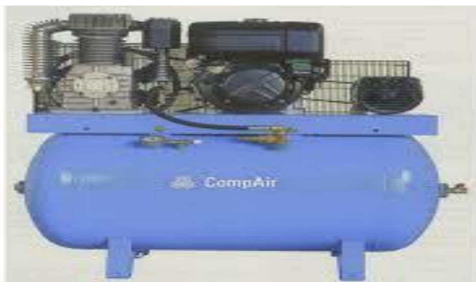
Figure2 : Compresseur